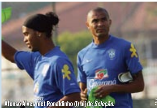
Afonso Alves met Ronaldinho (I) bij de Seleção.