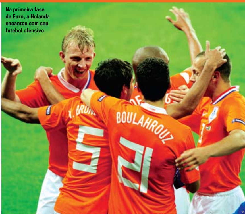
Na primeira fase da Euro, a Holanda encantou com seu futebol ofensivo

A fase seguinte, porém, mostrou que toda a euforia fora baseada em nada. A Rússia (daquele outro treinador holandês ainda mais esperto, Guus Hiddink) esmagou e espremeu a Laranja Mecânica, que mostrou ter um motor facilmente controlado e teleguiado pelos russos. Marco Van Basten, um principiante como trei-