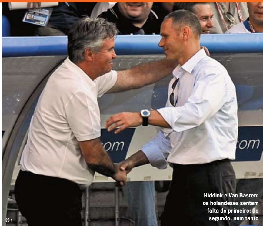
Hiddink e Van Basten: os holandeses sentem falta do primeiro; do segundo, nem tanto

Cruyff acha que a Holanda deve jogar sempre e em qualquer lugar com três atacantes